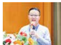
中山大学网络空间安全学院院长 操晓春教授