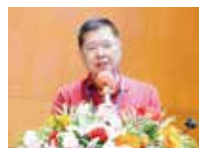
广东省计算机学会理事长 韩国强教授

自成立以来，广东省 IT 高等教育俱乐部组织开展各类研 讨会、交流会，并定期举办年度学术活动，以促进学科建设和 发展，助力新一代信息技术人才培养。至今已成功举办过 15 次年度活动，各类研讨会超过百场。在这些活动和会议上，来 自不同办学层次、不同办学类型的院校的 100 多位院长、主 任、杰出专家做出了报告分享，议题涉及政策解读、学科建设 经验、人才培养实践、科研成果分享等等。