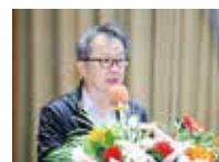
华南理工大学 计算机科学与工程学院院长 陈俊龙院士